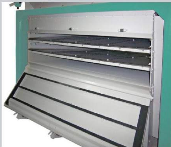
Lengva priežiūra / Lengvas sietų keitimas Lengvas priėjimas prie sietų per priekines dureles