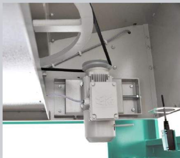
Saugumas Sumontuota apsaugos sistema nuo vibracijos ir momentinis stabdis greitam mašinos sustabdymui.